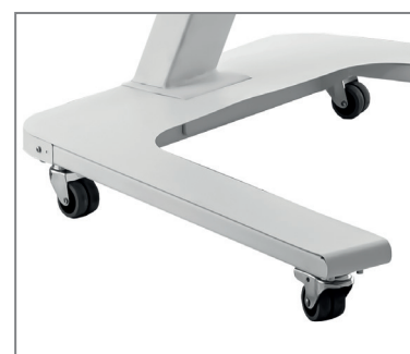
inkl. Rollenset, tlw. feststellbar