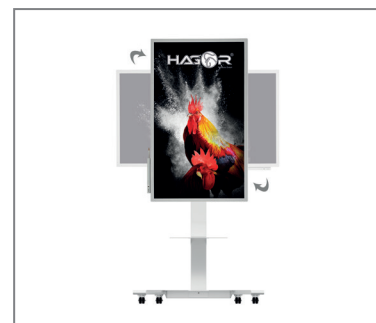
Wechsel der Ausrichtung ohne Entriegelung