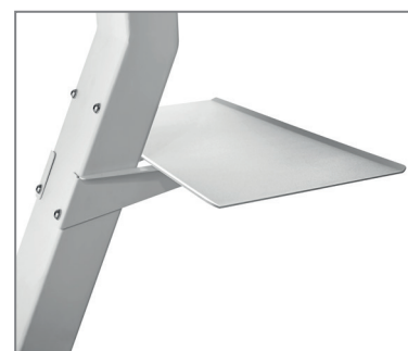
inkl. Ablage, optional verwendbar