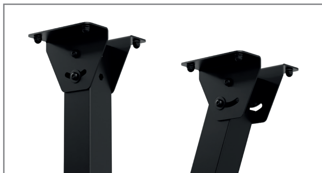
Die Deckenaufnahme ist \pm 30^\circ neigbar