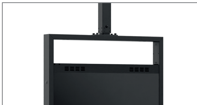
Kabelführung innerhalb des Rahmens